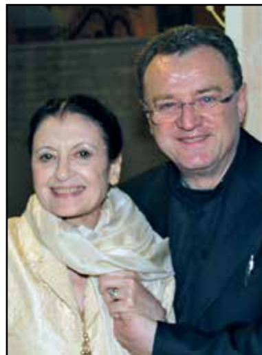
Don Italo con Carla Fracci.