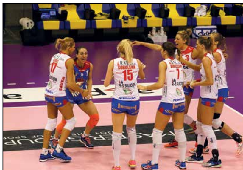
Felicità dopo un punto vinto dalla Metalleghe.

Termina la stagione sportiva della Metalleghe-Sanitaris pallavolo femminile, una annata che ha visto la presenza di numerosi tifosi che hanno sempre sostenuto la squadra sia nelle partite interne al Palgeorge che in trasferta. Storica conquista della fase finale della Coppa Italia, disputata con onore, così come aver bissato il play off del campionato. Sconfitta più che onorevole con la prima in classifica che pone fine alla stagione. Parole conclusive con fierezza del coach Barbieri "per un gruppo che sa superare gli ostacoli e che ha dimostrato di saper giocare da campioni".