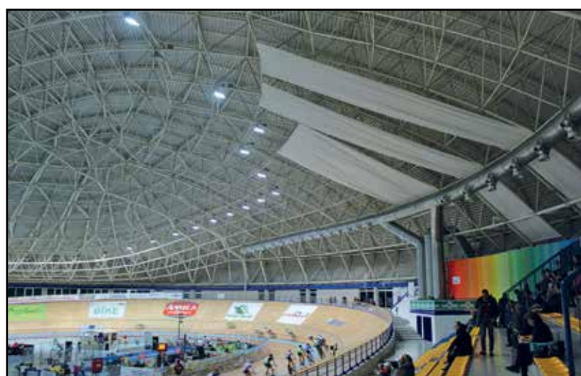
Alcuni teloni appesi non certo per coreografia.