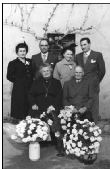
Ricordo fotografico dell'evento.