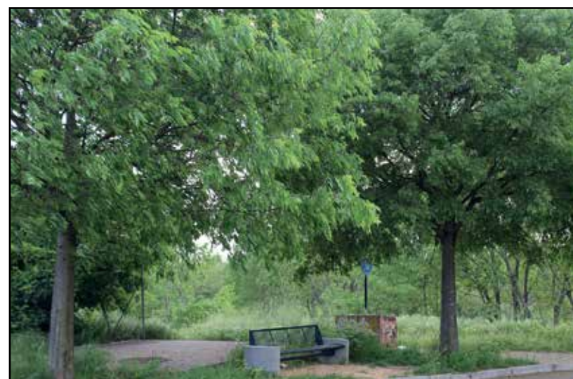
La panchina nei pressi del fiume Chiese.

Per me un piccolo angolo di paradiso, all'ombra di tre romiglie ben fatte che in questi giorni mostrano già formati i piccoli frutti che matureranno a settembre, e dunque trascorreremo insieme molte settimana