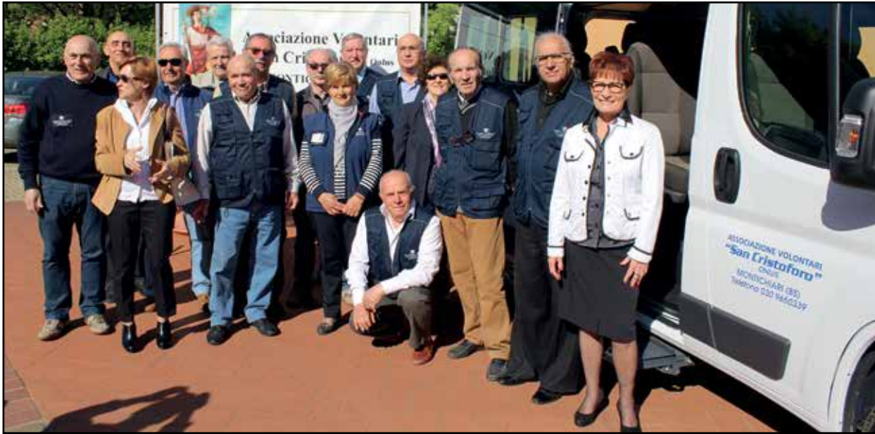
Da destra la Presidente Rossi con i volontari davanti al nuovo Ducato "Donato da Ristora".